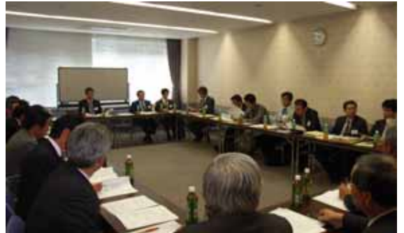
福岡市との意見交換会