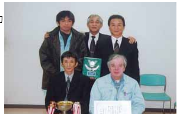
優勝：(株)日東技術コンサルタント